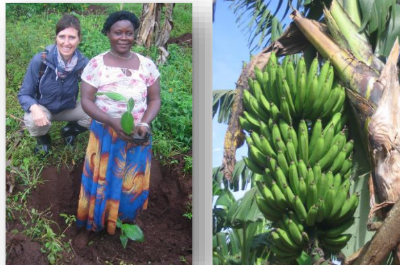
Bananenfeld für Farmerinnen