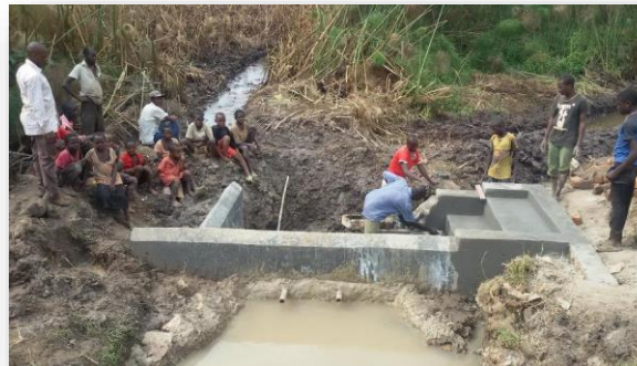
Schutz einer natürlichen Quelle